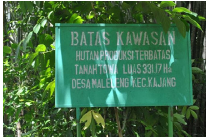
Hutan adat ditetapkan sebagai hutan produksi terbatas.

Dalam tiga puluh tahun terakhir, Masyarakat Adat Kajang di Bulukumba, Sulawesi Selatan, telah kehilangan sebagian besar dari wilayah adat mereka. PT. Lonsum (perusahaan tanaman karet) menguasai 5.000 hektar Hak Guna Usaha (HGU), yang tersebar di seluruh wilayah Kajang di Bulukumba. Masyarakat Adat Kajang saat ini hanya menguasai kurang dari 500 hektar hutan di dalam wilayah adat mereka.