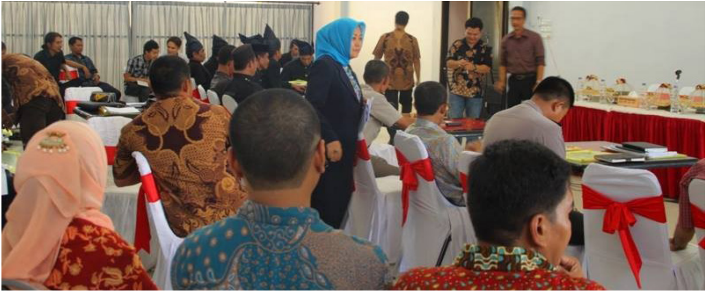
Pertemuan para pemangku kepentingan sebagai bagian dari proses PERDA.

Namun pelaksanaan keputusan MK35 penuh ketidakpastian. Berbagai peraturan dengan jelas menyatakan bahwa pengakuan masyarakat adat dan wilayah adat adalah mandat pemerintah daerah. Akan tetapi, pemerintah daerah biasanya cenderung mengatur dan bukan mengakui adanya hak tersebut (Safitri dan Uliyah, 2014).