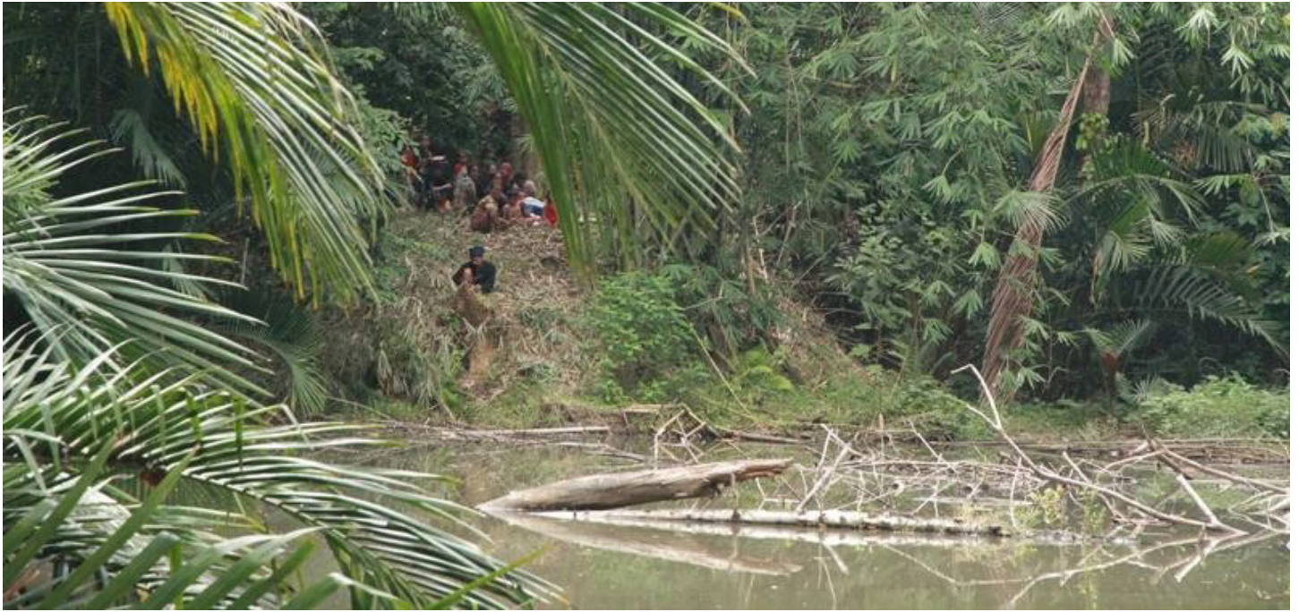
Danau Tukasi, bagian dari wilayah Kajang di Kecamatan Bulukumba.

Masih tidak jelas sejauh mana peran pihak ketiga dapat turut mengatur hutan adat, sehingga pengaruh Perda terhadap struktur pengelolaan semi formal yang ada masih tidak pasti. Perda ini tidak memuat aturan baru tentang tatanan kelembagaan yang sebelumnya tidak dikenal. Perda ini, dalam banyak bagian, lebih pada mengatur bagaimana menjaga struktur pengelolaan hutan yang sudah ada dengan menjamin hak penguasaan Masyarakat Kajang atas kawasan hutan adatnya.