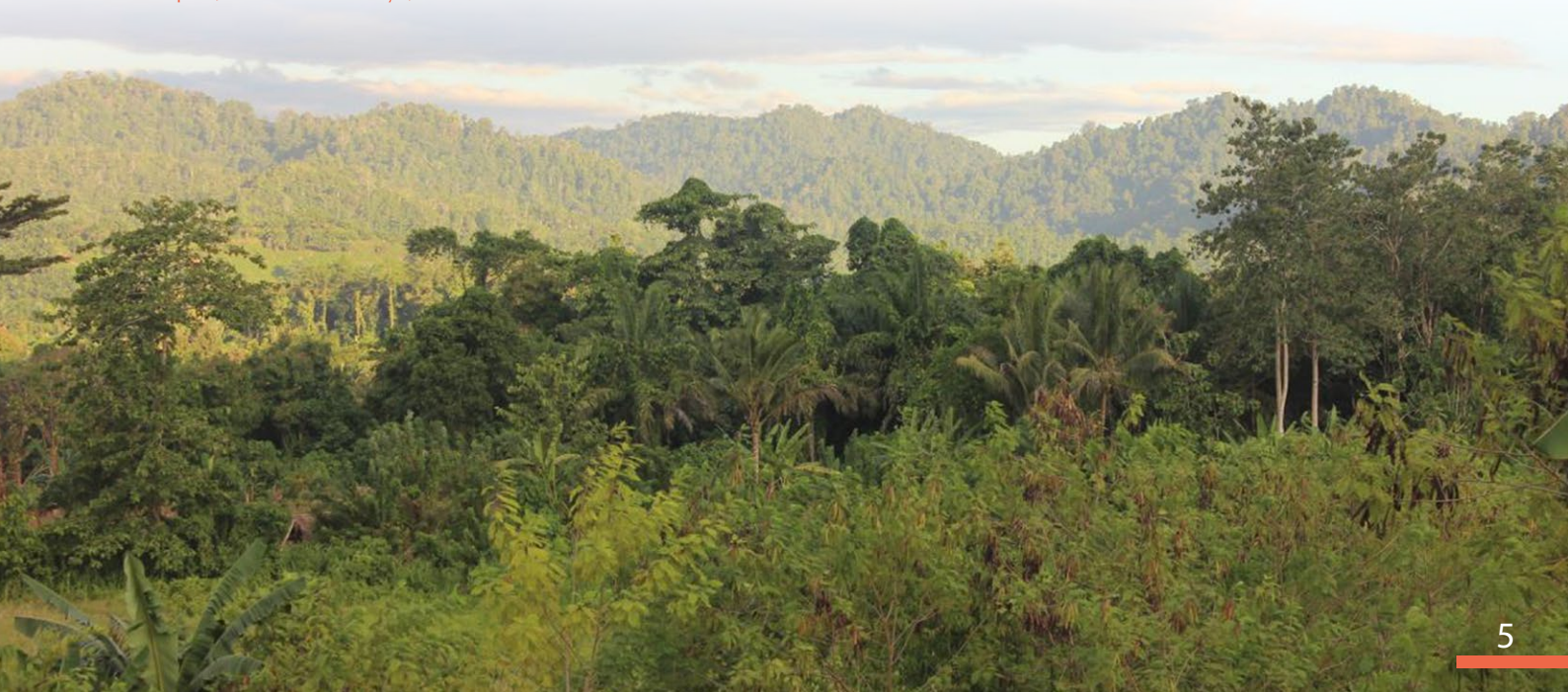
Kebun campur

Hasil kajian vegetasi di paragraph sebelumnya menunjukkan bahwa kebun campur merupakan jenis pengelolaan lahan alternatif ketika hutan tidak lagi berfungsi sebagai penyedia sumber mata pencaharian. Di sisi lain, kebun campur mampu menyediakan jasa lingkungan yang ditunjukkan luas bidang dasar tutupan pohon, meskipun tidak sama dengan hutan alami.