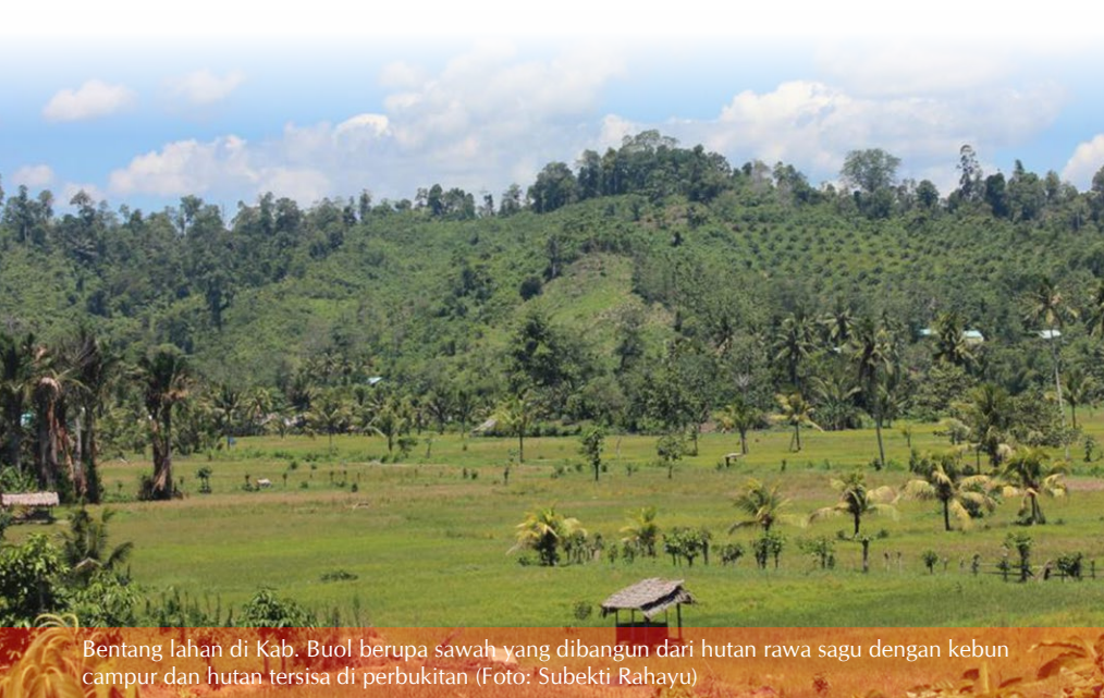
Bentang lahan di Kab. Buol berupa sawah yang dibangun dari hutan rawa sagu dengan kebun campur dan hutan tersisa di perbukitan

Oleh: Subekti Rahayu, Sidiq Pambudi, Dienda C.P. Hendrawan dan Ni'matul Khasanah