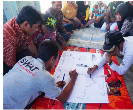
Kegiatan diskusi kelompok terfokus (FGD) yang diikuti petani perempuan dan laki-laki di Kabupaten Buol.

Di tingkat kabupaten, kegiatan FGD dititikberatkan untuk menggali informasi dari berbagai lembaga pemerintah yang terlibat dalam permasalahan lingkungan dan pemberdayaan masyarakat. Aturan, kebijakan serta permasalahan terkait lingkungan menjadi fokus utama dalam topik diskusi. Selain itu, dalam diskusi di tingkat kabupaten