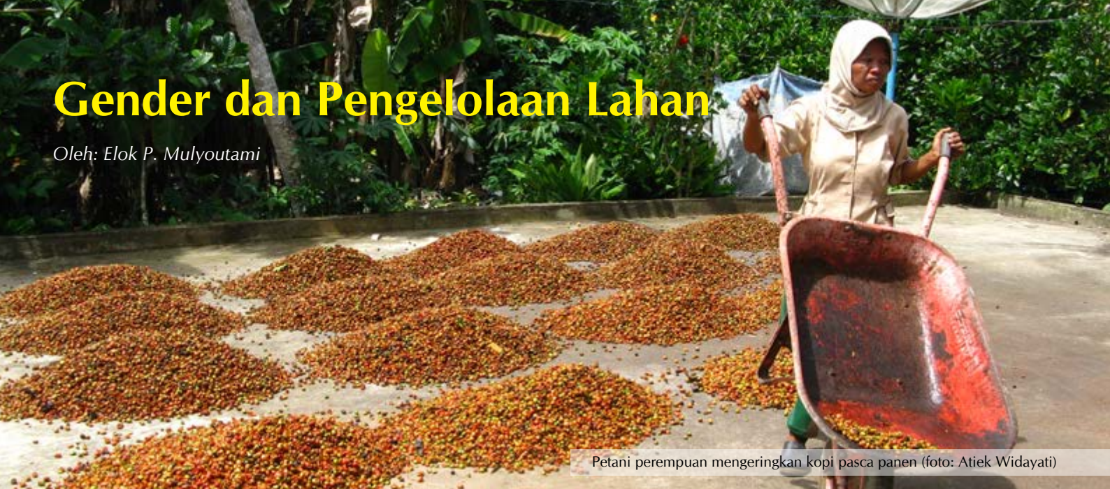
Petani perempuan mengeringkan kopi pasca panen

Diskusi hangat mengenai alternatif pemanfaatan lahan dalam mengatasi dan atau mengurangi dampak deforestasi sedang hangat berkembang di berbagai kalangan. Manusia yang memanfaatkan dan mengelola lahan berbeda dalam hal gender, umur, etnik, dan latar belakang pendidikan. Perbedaan ini menentukan pola perilaku mereka atas lahan dan juga sistem lahan tersebut. Tulisan ini mencoba mendiskusikan pentingnya isu gender dalam pemanfaatan lahan sebagai alternatif mengurangi dampak deforestasi. Pembahasan akan mengangkat persepsi gender dalam penghidupan masyarakat berbasis lahan dan pemilihan jenis-jenis komoditas yang ditanam di atas lahan. Beberapa cuplikan dari temuan studi di daerah Tanjung Jabung Barat dan Merangin, Provinsi Jambi, menjadi ilustrasi.