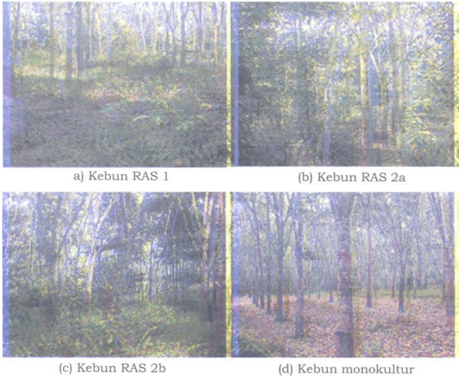
Gambar 1. Lokasi penelitian, kebun RAS 1, RAS 2a, RAS 2b, dan kebun karet monokultur