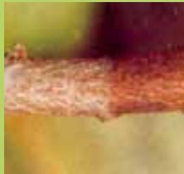
Tingkatan rumah laba-laba