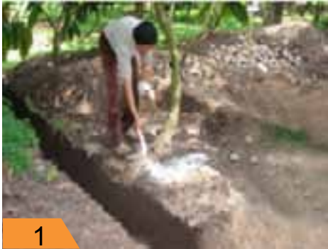
1 300 g kapur ditabur.