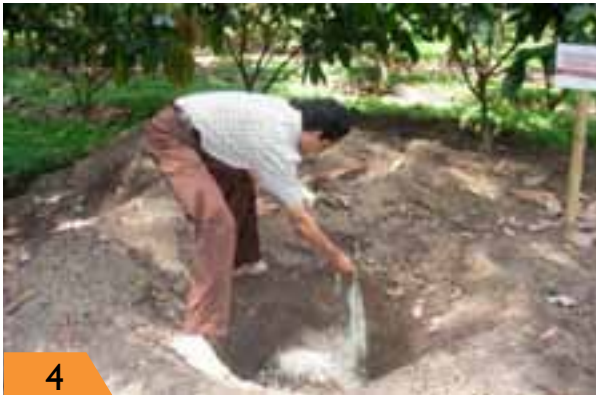
4 Lubang bekas tanaman yang sakit ditabur 300 g belerang.