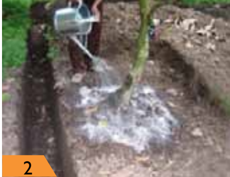
2 60 g urea + 2 liter air disiramkan. Ditutup seresah.