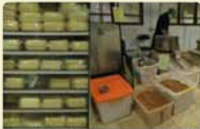
Produk: Mentega coklat dan coklat bubuk