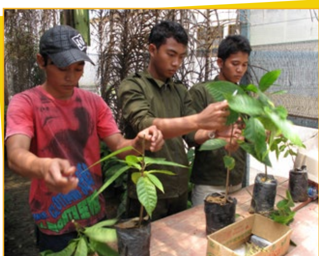
▲ Pada tahun 2010, 240 siswa Bone Bone memilih kakao sebagai subyek spesialisasi. Beberapa dari siswa tersebut akan menjadi pelatih dan penyuluh

Mars mulai bekerja sama dengan SMKN pada tahun 2007 setelah Hussin memberikan presentasi di hadapan staf SMKN Bone Bone, di Kabupaten Luwu Utara.