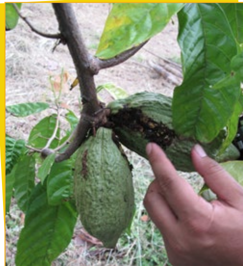
▲ Usaha awal yang dilakukan oleh Mars di Sulawesi adalah mengurangi kerugian akibat hama dan penyakit

“Kami memilih daerah di sekitar Noling, Sulawesi Selatan, sebagai tempat pelaksanaan proyek PRIMA karena banyak permasalahan yang dihadapi para petani di sana,” kenangnya. Para petani mengalami kerugian besar karena serangan hama dan penyakit,