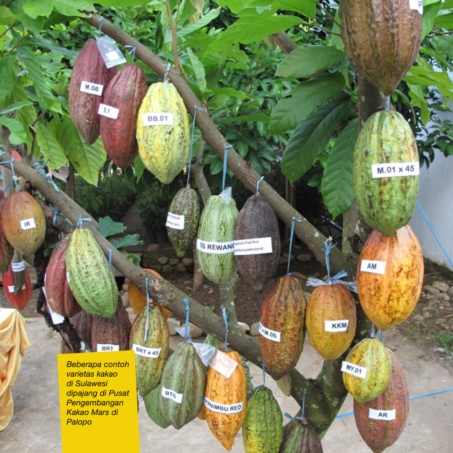
Beberapa contoh varietas kakao di Sulawesi dipajang di Pusat Pengembangan Kakao Mars di Palopo