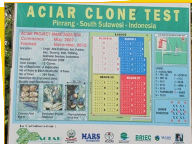
▲ Penelitian kolaboratif yang memfokuskan pada pengembangan klon unggul tahan hama, seperti penggerek buah kakao

“Sekitar 20 tahun yang lalu, kami biasa mendapatkan hasil panen lumayan,” jelasnya ketika dia menunjukkan kebun kakaonya kepada kami. “Namun, pada saat Hussin datang, hama penggerek buah kakao sedang menjadi masalah dan menimbulkan banyak kerusakan.” Berkat kegiatan PRIMA, kerugian yang dialami para petani akibat hama tersebut berkurang secara signifikan. Mereka berhasil mengurangi akibat serangan hama dengan mengadopsi ‘praktik-praktik budidaya kakao yang baik’ yang dipromosikan oleh PRIMA. Praktik ini meliputi pemangkasan, sanitasi lingkungan, meningkatkan frekuensi pemanenan, penggunaan pupuk dengan dosis 1 - 1,2 ton per hektar per tahun, dan menyemprotkan pestisida yang tepat 10 kali setahun. (Lihat Kotak 1: Mengalahkan musuh)