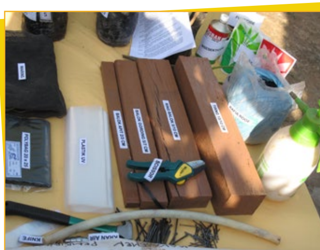
▲ Pendukung perbaikan kehidupan - peralatan yang diperlukan para petani untuk membangun pembibitan kakao

Benih kolaborasi yang luar biasa ini ditaburkan pada tahun 2005, ketika Mars dan International Finance Corporation (IFC), bagian dari Bank Dunia sebagai pengelola keuangan sektor swasta, bertemu untuk mendiskusikan masa depan industri kakao di Indonesia. Jelas bahwa program yang ada pada saat itu, termasuk PRIMA, tidak bisa memecahkan