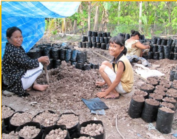
▲ Bertani coklat adalah bisnis keluarga. Mengisi kantung polietana dengan batang bawah pohon kakao di klinik kakao desa

Hussin menekankan bahwa melatih petani memiliki manfaat