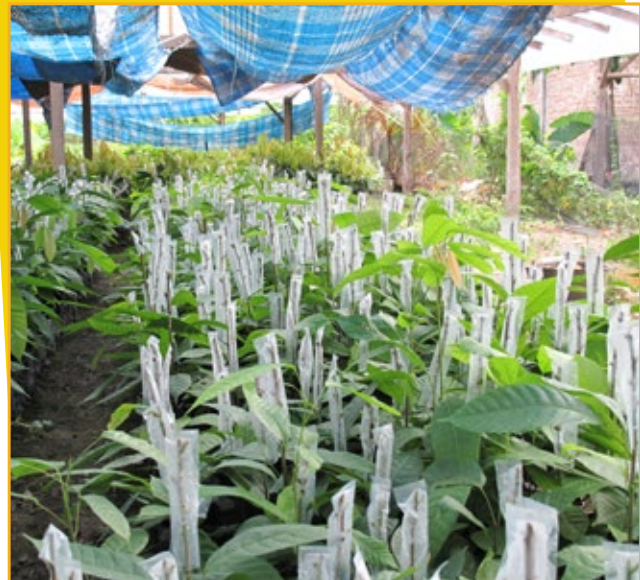
▲ Klinik kakao desa seperti ini melayani hingga 170 petani per klinik

Muis menanam 5.000 bibit yang dijual pada tahun 2008, 10.000 bibit pada 2009, dan 32.000 bibit pada 2010. Dia sekarang menjual bibit tersebut dengan harga Rp 4.750 (US$0,50), yang berarti dia mendapatkan keuntungan Rp 2.375