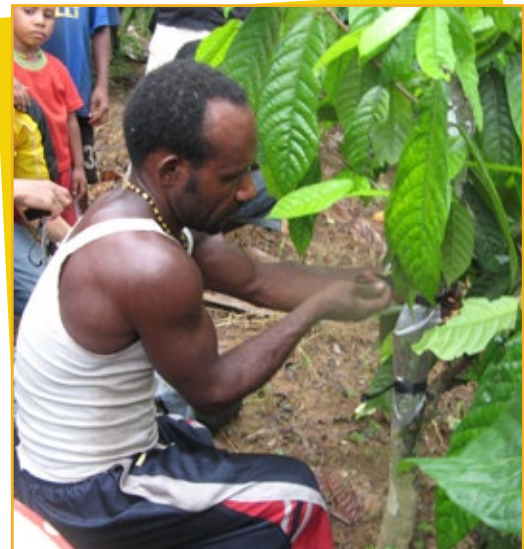
▲ Belajar untuk mengokulasi di Mars Cocoa Development Centre di Alang Alang, Papua