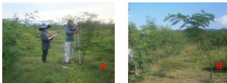
Gambar 3. Pertumbuhan tanaman pakan ternak, lamtoro

Kondisi yang relatif sama tampak pada pengamatan diameter tanaman lamtoro. Nilai rata - rata tinggi relatif sama diawal pengamatan namun kemudian berkembang signifikan pada bulan – bulan berikutnya. Pola multipurpose trees tampak merupakan pola tanam yang memiliki perkembangan diameter terbaik dibanding dua pola lainnya sedangkan agrosilvopasture merupakan pola tanam yang memiliki nilai rata – rata diameter terendah. Nilai rata – rata diameter pola tanam silvopasture merupakan median diantara dua pola tanam tersebut namun cenderung mendekati pola tanam agrosilvopasture .