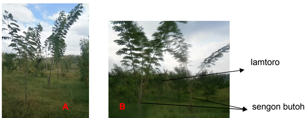
Gambar 2. Pertumbuhan tanaman pokok, sengon butoh

Demikian pula pada pertumbuhan diameter, berdasarkan pengamatan dapat diketahui bahwa secara umum diameter tanaman adalah sama namun kemudian berubah secara signifikan pada bulan – bulan berikutnya. Agroforestri dengan pola silvopasture dengan multipurpose trees masih merupakan pola tanam terbaik yang ditunjukkan oleh perkembangan diameter yang lebih baik dibanding tiga pola tanam lainnya. Kontrol merupakan pola tanam dengan rata – rata diameter tanaman yang rendah.