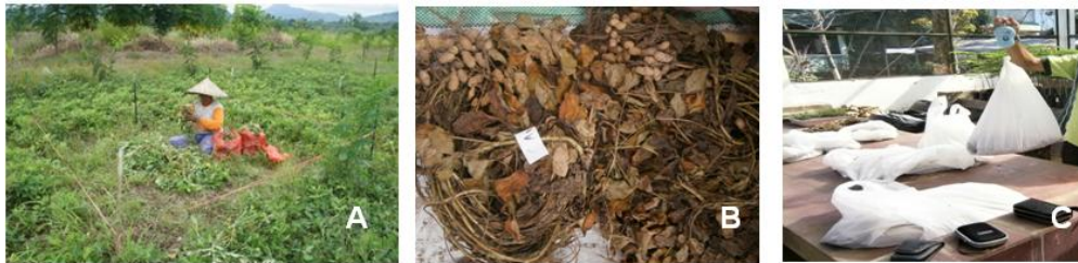
Gambar 3. Pengambilan data tanaman semusim kacang tanah

Apabila dibandingkan dengan hasil pertanian tahun 2007 di Kab. Gowa tersebut, produktivitas kacang tanah di spoilbank Bili-Bili termasuk rendah. Hal ini kemungkinan besar disebabkan karena tingkat kesuburan dan struktur tanah di spoilbank Bili-Bili memang rendah sehingga perakaran dan pembentukan biji kacang tanah kurang baik. Selain itu bisa juga disebabkan karena perbedaan benih kacang yang digunakan. Para petani biasanya menggunakan benih kacang unggulan untuk menaikkan produksi kacang tanah mereka, sementara pada penelitian ini, benih kacang yang digunakan hanya benih kacang biasa yang dijual di pasaran sehingga mempunyai produktivitas yang rendah. Biji kacang yang dihasilkan pun relatif lebih kecil bila dibandingkan kacang yang dijual pada umumnya.