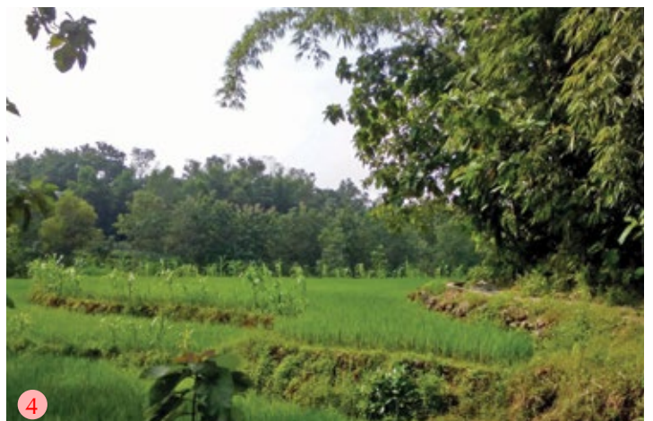
(3) Sistem agroforestri padi di zona tengah; (4) pohon kayu ditanam sebagai pembatas lahan, dan tanaman semusim lain ditanam pada pematang