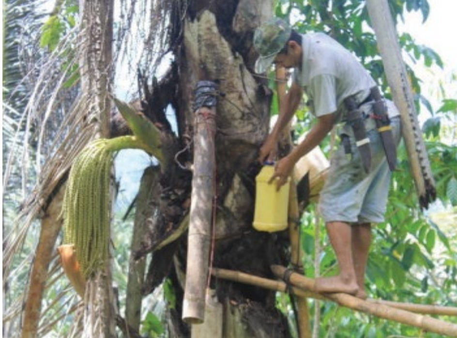
Petani di Desa Dulamayo Selatan, Kecamatan Telaga, Kabupaten Gorontalo sedang menyadap nira aren.

Oleh : Sahabuddin, Hamsir, Iqbal dan Paharuddin