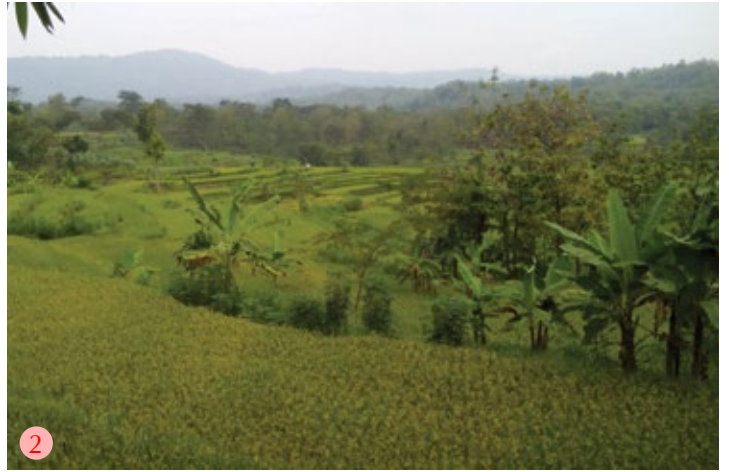
(1) Sistem agroforestri padi bentuk lorong: padi dan rumput gajah ditanam di antara pohon jati; (2) Sistem agroforestri padi bentuk teras: jati, turi dan pisang ditanam pada teras-teras

dengan cara disebar, tetapi saat ini petani menanam dengan cara ditugal. Penerapan jarak tanam telah dilakukan oleh petani, misalnya 20 cm x 30 cm atau variasi jarak tanam lainnya tergantung keinginan petani.