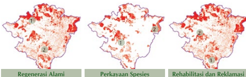
Peta Lokasi dan Klaster Prioritas Restorasi Hutan dan Bentang Lahan berdasarkan pembobotan tipe tutupan lahan dan kriterianya