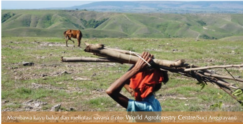
Membawa kayu bakar dan melintasi savana

Oleh: Elok Mulyoutami & Gerhard Manurung