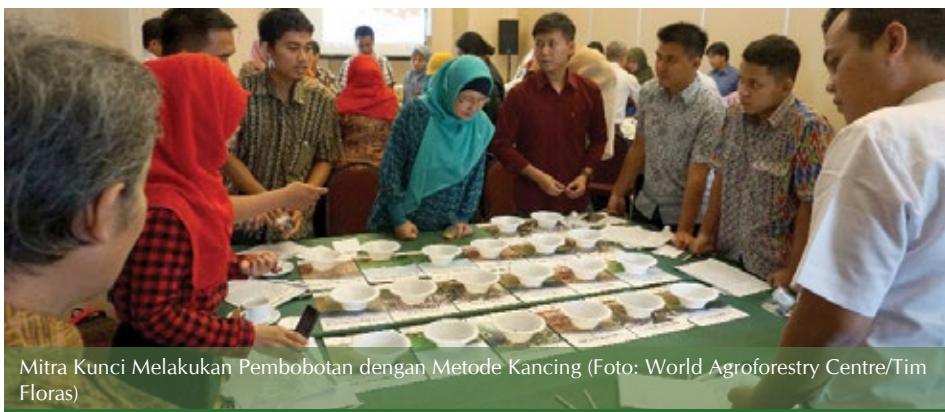
Mitra Kunci Melakukan Pembobotan dengan Metode Kancing

Kegiatan restorasi merupakan upaya jangka panjang secara partisipatif dalam memulihkan fungsi suatu kawasan yang memerlukan komitmen dan kesabaran para pihak untuk bekerjasama agar kegiatan ini dapat menjadi pembelajaran upaya restorasi hutan dan lahan dimasa yang akan datang.