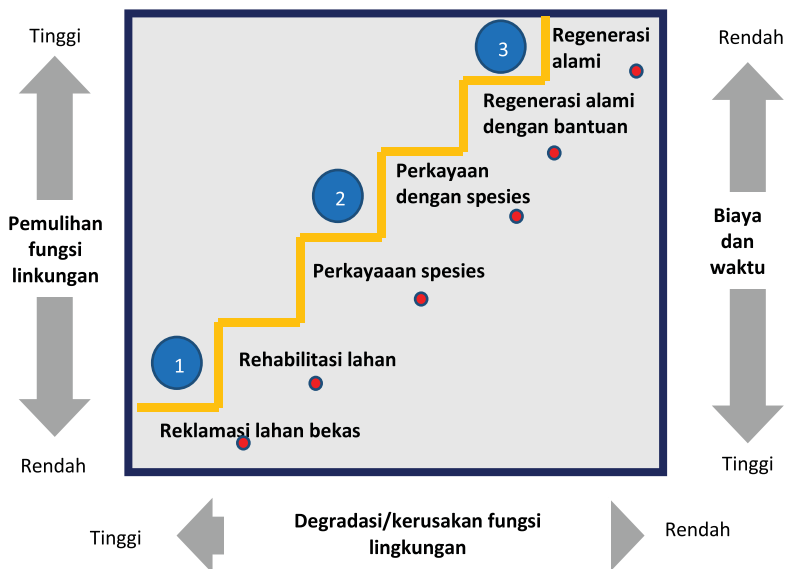
Jenjang Rentang yang Memperhatikan Tingkat Gangguan, Biaya dan Tingkat Sukses

Dengan menumpang-tindihkan berbagai peta tutupan lahan dan peta fungsi kawasan di suatu daerah didapatkanlah peta peluang restorasinya. Dari peta tersebut selanjutnya ditentukan opsi intervensi restorasi yang sesuai dan memberikan bobot pada masing-masing tipe tutupan lahan untuk mendapatkan tipe tutupan lahan yang potensial untuk direstorasi. Secara umum terdapat tiga kelompok opsi intervensi yang dapat dilakukan untuk merestorasi hutan dan bentang lahan yaitu: regenerasi alami, pengkayaan spesies/agroforestri, rehabilitasi dan reklamasi. Berdasarkan kajian para pakar restorasi, pilihan atau opsi RENTANG ditentukan dengan memperhatikan tingkat gangguan, biaya dan waktu pemulihan, serta tingkat keberhasilan pemulihan.