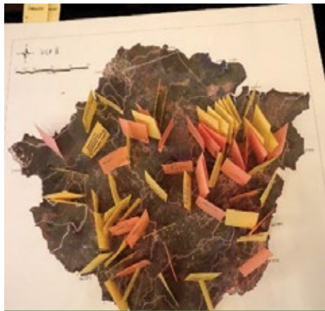
Peta Permasalahan Bentang Alam dan Lingkungan di Sumatera Selatan.

Para peserta diskusi yang merupakan anggota Forum DAS dan Kelompok Kerja mengidentifikasi permasalahan lingkungan, penyebab, dan upaya restorasi yang sudah dilakukan di daerahnya masing-masing. Keluaran dari kegiatan ini berupa peta permasalahan, penyebab, dan upaya restorasi.