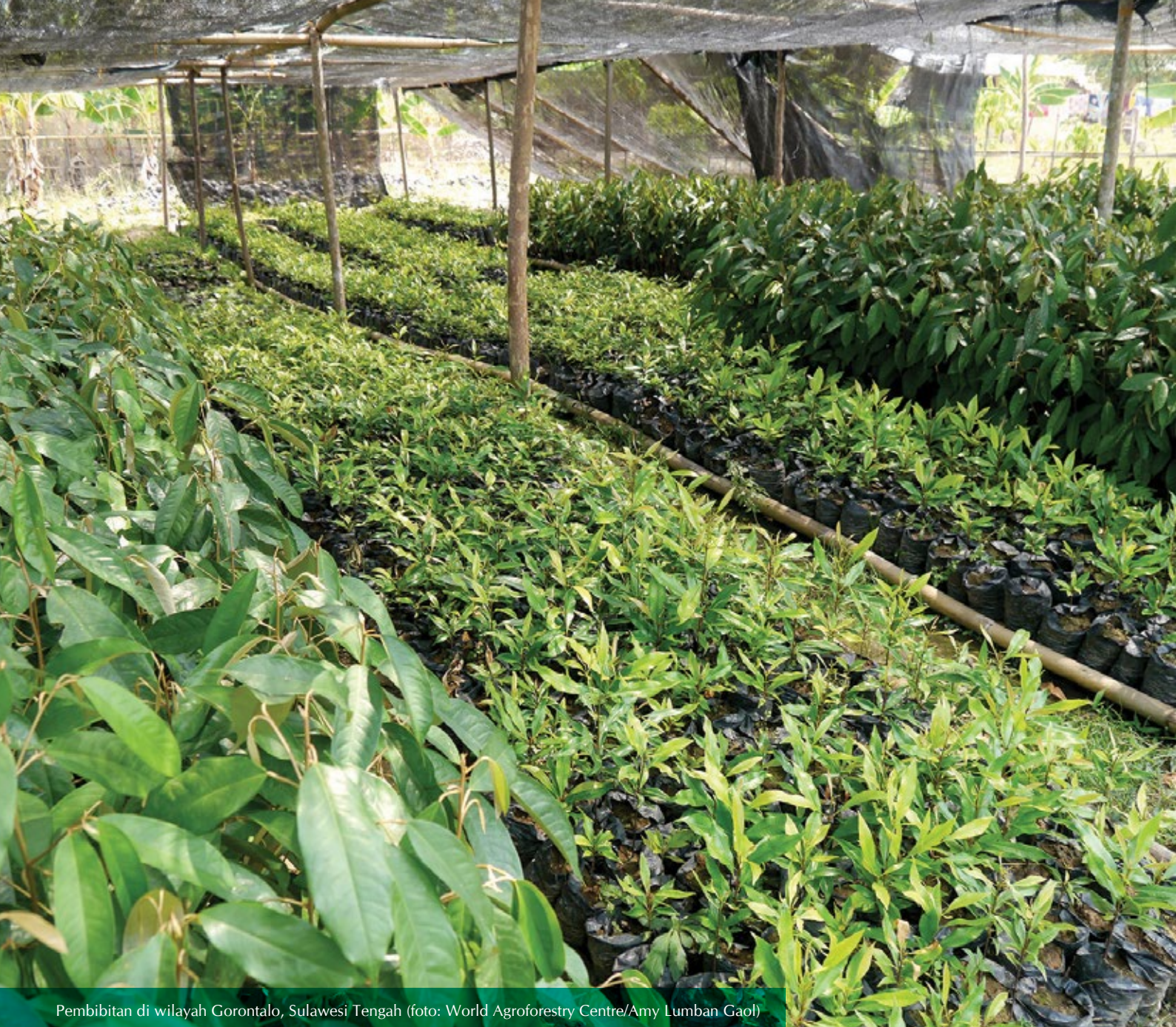
Pembibitan di wilayah Gorontalo, Sulawesi Tengah