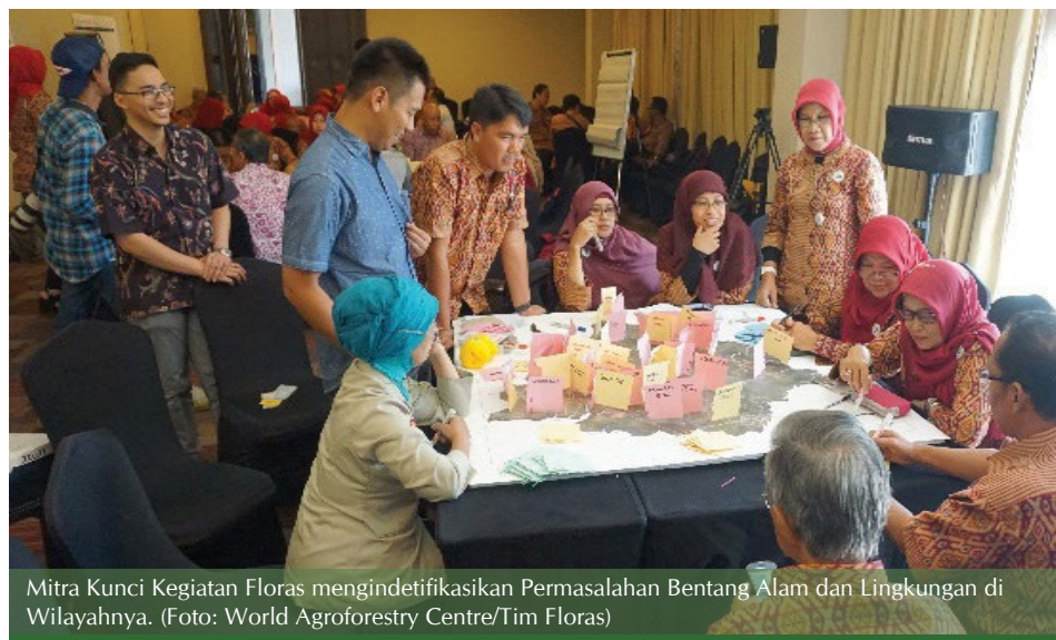
Mitra Kunci Kegiatan Floras mengidentifikasi Permasalahan Bentang Alam dan Lingkungan di Wilayahnya.

Langkah awal kegiatan FLORAS dilakukan dengan menyamakan persepsi, serta menentukan tujuan restorasi melalui diskusi kelompok.