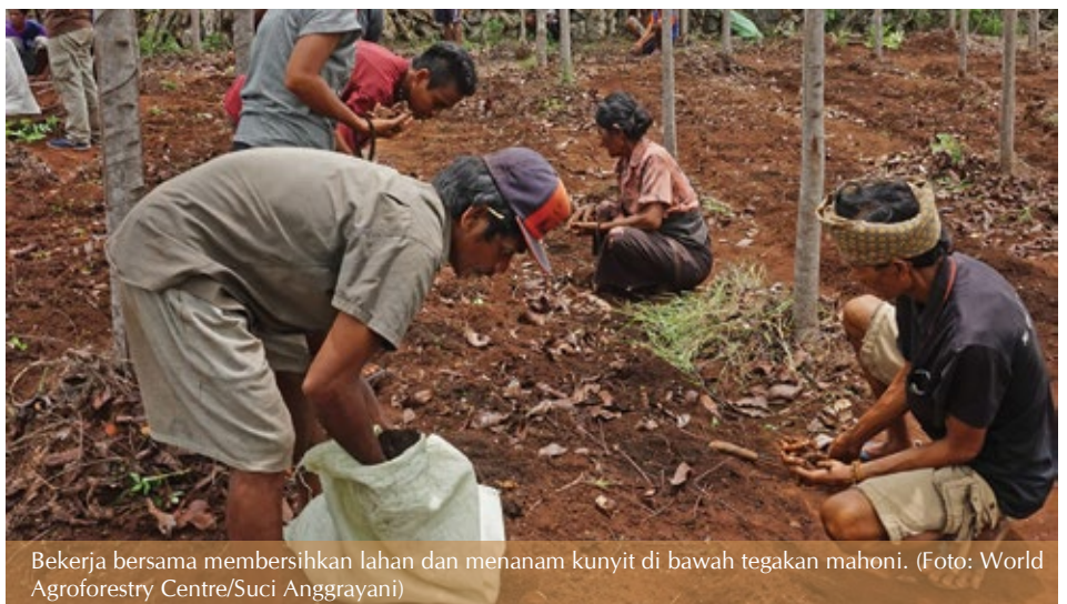
Bekerja bersama membersihkan lahan dan menanam kunyit di bawah tegakan mahoni.

Tidak ada yang tidak mungkin terjadi, tetapi perlu memperhatikan pendekatan yang sesuai dengan budaya dan struktur sosial masyarakatnya. Beberapa pendekatan praktis dan strategis yang dikemukakan dalam tulisan ini bisa menjadi pertimbangan untuk diimplementasikan dalam kegiatan restorasi bentang lahan.