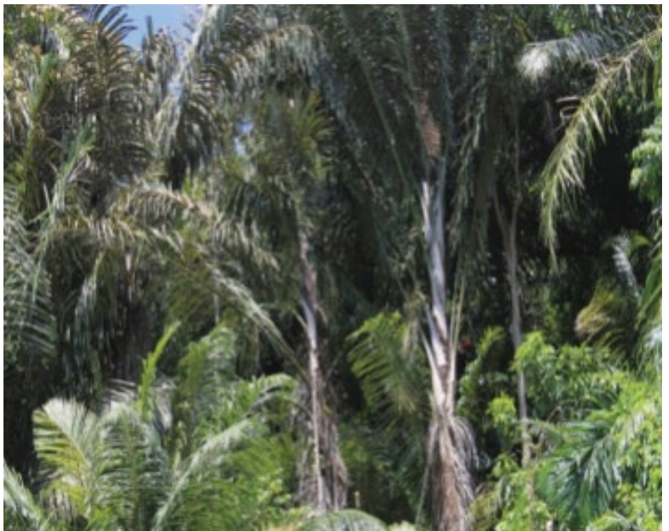
Kiri atas: Petani di Desa Dulamayo Selatan, Kecamatan Telaga, Kabupaten Gorontalo mengangkut hasil sadapan nira aren dari kebun menuju ke rumah, Kanan atas: Pohon aren siap sadap di Desa Dulamayo Selatan, Kecamatan Telaga, Kabupaten Gorontalo, Bawah: Pohon aren diantara pohon-pohon lain di Kebun agroforestri milik petani di Desa Dulamayo Selatan, Kecamatan Telaga, Kabupaten Gorontalo .

dijual dalam bentuk tuak atau petani membatasi sadapannya karena kendala tersebut hal ini pula yang menjadi penyebab banyaknya pohon aren yang tidak disadap karena keterbatasan tenaga. Sementara itu, buah aren yang tersedia melimpah belum dimanfaatkan di desa ini—hanya sebagian kecil yang