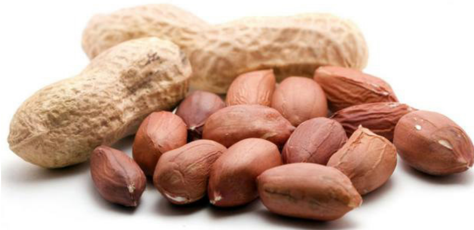
Gambar 1. Kacang tanah ( Arachis hypogaea ).

Kacang tanah ( Arachis hypogaea ) sudah tak asing lagi bagi masyarakat Kecamatan Haharu, Sumba Timur. Selain untuk dikonsumsi, masyarakat menanam kacang juga untuk dijual. Pemerintah daerah menyadari potensi kacang tanah yang menjanjikan, sehingga memberikan dukungan melalui bantuan benih maupun alat-alat pertanian.