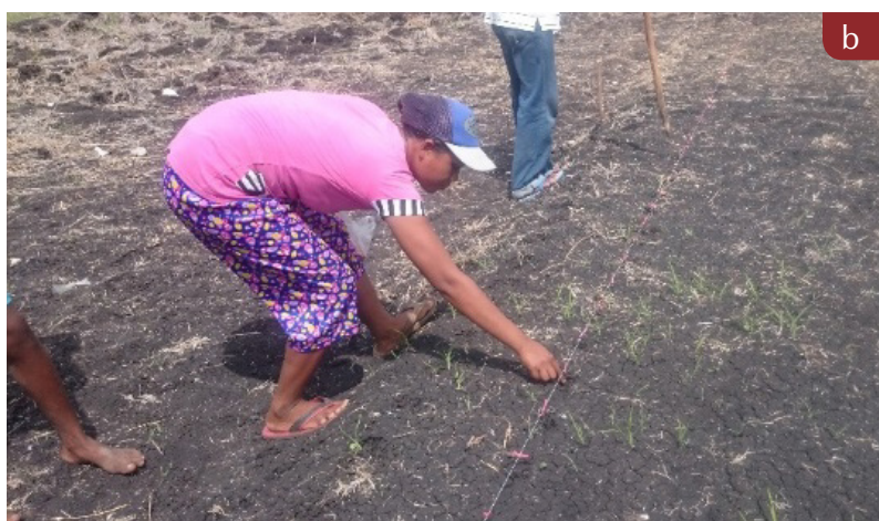
Gambar 3. a) Kualitas benih kacang tanah; b) Teknik penanaman kacang tanah.