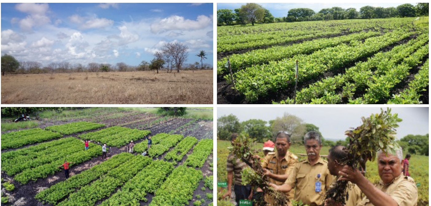
Gambar 5. Kebun penelitian kacang tanah di Desa Wunga.

Proyek IRED telah melakukan uji coba penanaman kacang tanah di bedengan ukuran 10 m x 1,5 m x 15 cm (panjang x lebar x tinggi) dan jarak antar bedeng \pm 50 cm. Jarak tanam kacang tanah adalah 40 cm x 20 cm. Perlakuan pemupukan dan jumlah biji (benih) per lubang tanam diujicobakan pada penanaman kacang tanah jenis Lokal dan jenis Tuban. Hasil panen polong kering dari jenis Lokal dan Tuban untuk setiap perlakuan pemupukan dapat dilihat pada Tabel 1.