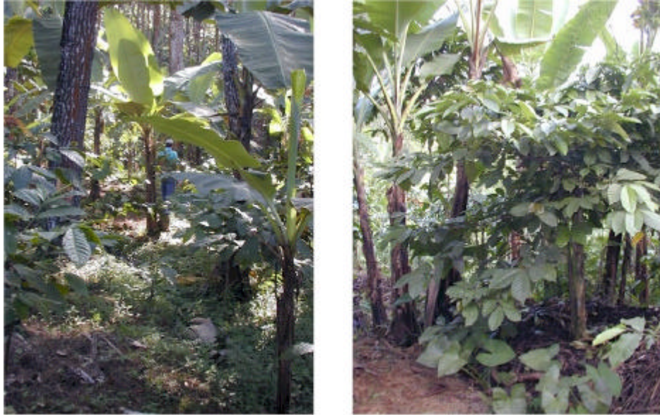
Gambar 1. Sistem agroforestri sederhana di Ngantang, Malang Jawa Timur. Kopi dan pisang ditanam oleh petani diantara pohon pinus milik Perum Perhutani (Gambar kiri). Gliricidia dan pisang ditanam sebagai naungan pohon kopi (Gambar kanan) (Foto: Meine van Noordwijk).