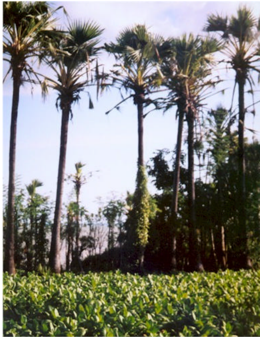
Gambar 2. Agroforestri Sederhana: Tembakau ditanam diantara barisan pohon siwalan di Sumenep, Madura.

Perpaduan pohon dengan tanaman semusim ini juga banyak ditemui di daerah berpenduduk padat, seperti pohon-pohon randu yang ditanam pada pematang-pematang sawah di daerah Pandaan (Pasuruan, Jawa Timur), kelapa atau siwalan dengan tembakau di Sumenep–Madura (Gambar 2). Contoh lain, tanah-tanah yang dangkal dan berbatu seperti di Malang Selatan ditanami jagung dan ubikayu diantara gamal atau kelorwono ( Gliricidia sepium ).