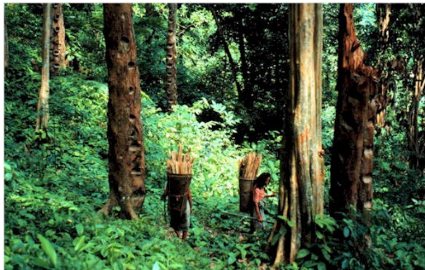
Gambar 4. Agroforest Kompleks: Kebun damar di Krui, Lampung Barat (De Foresta et al, 2000)

Dibandingkan sistem agroforestri sederhana, struktur dan penampilan fisik agroforest yang mirip dengan hutan alam merupakan suatu keunggulan dari sudut pandang pelestarian lingkungan (Gambar 4). Pada kedua sistem agroforestri tersebut, sumberdaya air dan tanah dilindungi dan dimanfaatkan. Kelebihan agroforest terletak pada pelestarian sebagian besar keaneka-ragaman flora dan fauna asal hutan alam (Bompard, 1985; Michon, 1987; Seibert, 1988; Michon, 1990).