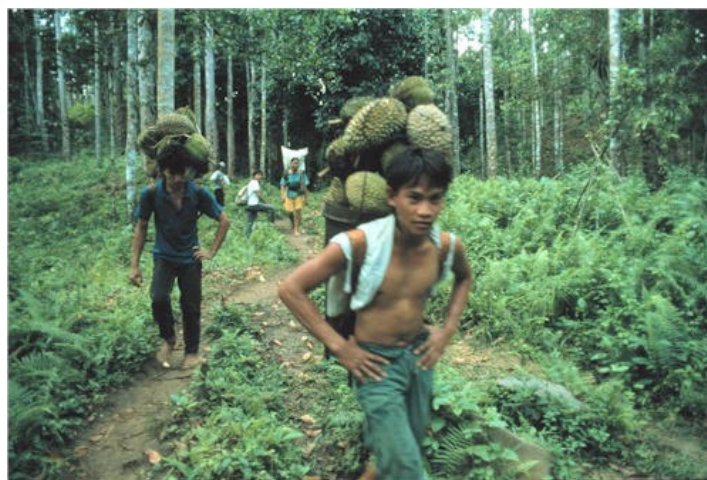
Gambar 6. Durian: Salah satu hasil tambahan