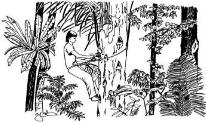
Gambar 7. Pemanenen getah damar (Michon dan de Foresta, 2000).

Agroforest di Indonesia, yang bertumpu pada hasil hutan non kayu, merupakan salah satu alternatif menarik terhadap domestikasi monokultur yang lazim dikerjakan. Pengelolaan agroforest tidak eksklusif pada satu sumber daya yang terpilih saja, tetapi memungkinkan kehadiran sumber daya lain. Selain itu agroforest merupakan strategi masyarakat sekitar hutan untuk memiliki kembali sumber daya hutan yang pernah hilang atau terlarang bagi mereka. Agroforest memungkinkan adanya pelestarian wewenang dan tanggung jawab masyarakat setempat atas seluruh sumber daya hutan. Hal ini merupakan sifat utama agroforest, namun sifat tersebut mungkin menjadi kendala utama pengembangan sistem agroforest oleh badan-badan pembangunan resmi terutama kalangan kehutanan, yang merasa khawatir akan kehilangan kewenangan menguasai sumber daya yang selama ini dianggap sebagai domain eksklusif mereka.